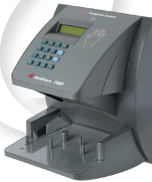
HandPunch 2000 Acepta 512 Usuarios