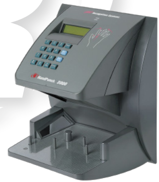
HandPunch 3000 Acepta 512 Usuarios (Expandible a 9,728 / 32,512 ó más)