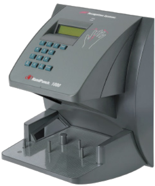
HandPunch 1000 Acepta 50 Usuarios (Expandible a 100 ó 512)